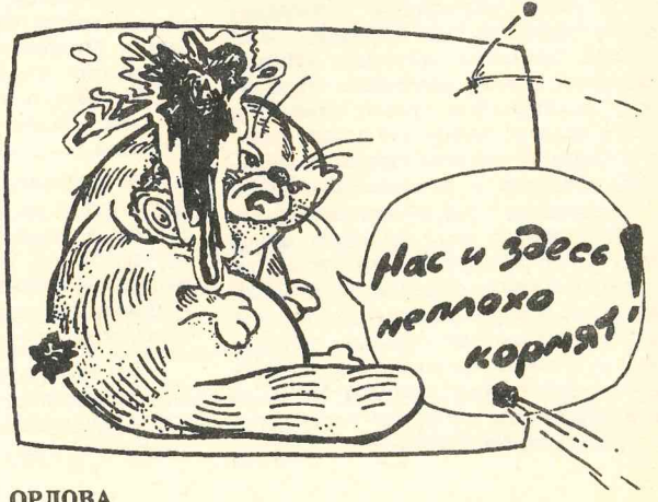
Рис. С. ОРЛОВА