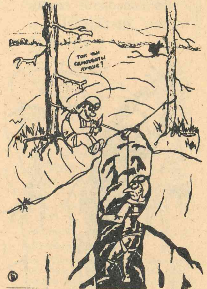
Рис. В. БОГДАНОВА