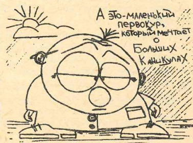
Рис. И. КУЗНЕЦОВА