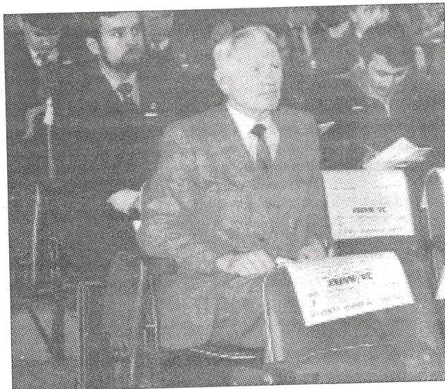
На комсомольскую конференцию всегда готовился спецвыпуск «За науку»

комсомольский редактор с 1985 по 1988 гг.