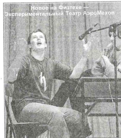
Новое на Физтехе — Экспериментальный Театр АэроМехов

Вечерний концерт хозяев. В строю местных СТЭМов пополнение: команда КВН ФАЛТ решила остаться на сцене уже в качестве творческого коллектива и назвала себя Эй ТАМ (Экспериментальный Театр АэроМехов). Так же честь столицы отстаивали физики из Восьмого Творческого Объединения МИФИ. По-прежнему на поле битвы за зрителя вышли ЭТО ТЪМА, СТЭМ ФОПФ, СТЭМ ФУПМ, ТОР-Тик. МИФИ выглядел сильнее как в силу своей новизны для местной публики, так и в силу еще одного обстоятельства. Наши СТЭМы обычно изображают физика в быту, на досуге, в лучшем случае — за учебной, но вот непосредственно физика, занятого физикой, на сцене можно увидеть редко. У МИФИ такой номер был, хотя не исключено, что это древняя классика, а не основной репертуар.