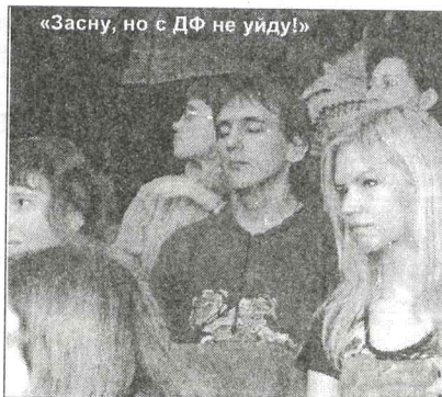
«Засну, но с ДФ не уйду!»