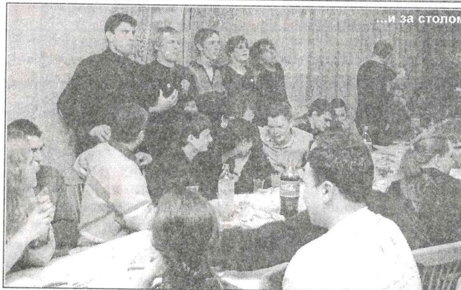
...и за столом

Оргкомитет ДФ-2004 благодарит всех, кто помогал провести это мероприятие: