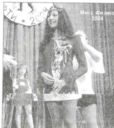
Мисс Физика 2004