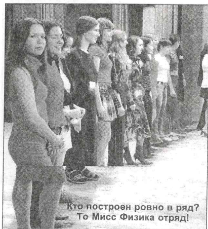
Кто построен ровно в ряд? То Мисс Физика отряд!

Официального банкета в этот день не было, а неофициальный логично вытекал из концерта.