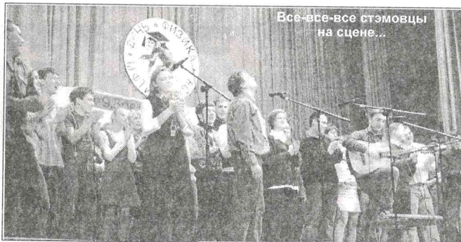
Все-все-все стэмовцы на сцене...