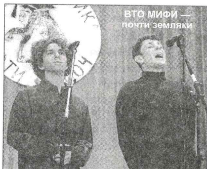
ВТО МИФИ — почти земляки

Суббота, день третий. Усталости пока нет, да и не к месту она: день открывался спортивными соревнованиями и конкурсом «Мисс Физика». Спорт у нас занимают постоянно, а вот Мисс выбирают раз в год. В этот раз претенденток объявилось больше, чем в прошлой, и все они явились на конкурс совершенно добровольно (на МФ-2003 девушек буквально ловили в коридорах, но это только придало конкурсу непосредственности). Все девушки были красивые и бодрые. Задания на конкурсе были настолько универсальными (рисовать помадой на теле, встретить пьяного супруга), что в принципе участвовать могли все: от школьниц до пенсионерок, от кондитера до балерины. Девушки пытались скрасить этот недочет организаторов и вставляли в свои шутки такие сугубо физтеховские слова как «матан» и «форум ФРТК».