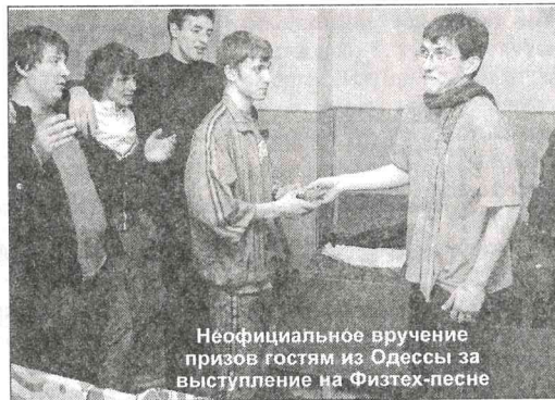
Неофициальное вручение призов гостям из Одессы за выступление на Физтех-песне

Открытие ДФ в этом году было решено провести. И его провели. В тесном кругу организаторов и приближенных к ним лиц. На этот раз не под открытым небом в 10 утра, а вечером в концертном зале.