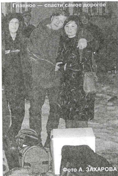
Главное — спасти самое дорогое