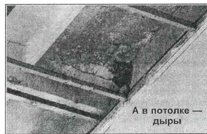
А в потолке — дыры

Прочитав изложенное в двух абзацах, вспомните трагедию в аквапарке «Трансвааль» и постарайтесь испытывать поменьше отрицательных эмоций по поводу закрытия бассейна.