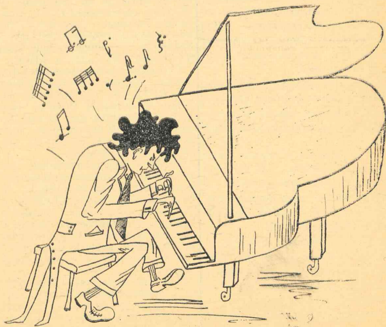
Рисунок И. Бадаевова.