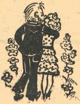
Рис. И. Бадаевой

Вначале все шло как по маслу. После краткой речи замдекана на поле битвы вышли представители организаций, желающих получить пополнение. Сладкими голосами сирен пропели они гимн своему институту и тем славным ребятам, которые готовы влиться в ряды его сотрудников. Под их медоголосые напевы служебная лестница так и бежала вниз под ногами, а трехзначные цифры становились все больше и больше.