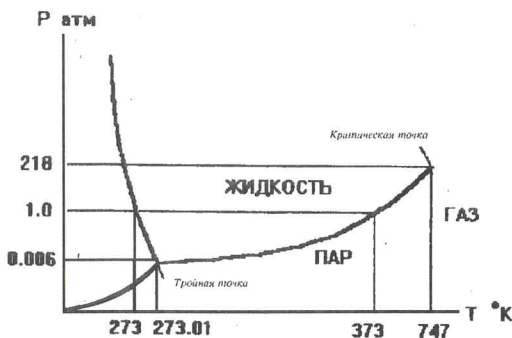
Рис. Фазовая диаграмма для воды (шкалы нелинейны)

Вулканическая деятельность на Марсе (движение тектонических плит) прекратилась пару сот миллионов лет тому назад, что и привело к деградации планеты. Однако около миллиарда лет тому назад тектоническая и вулканическая деятельность была еще активной, что способствовало нагреванию поверхности и обмену веществ между недрами и атмосферой, ее уплотнению и образованию гидросферы. О бурной деятельности вулканов в прошлом говорят застывшие лавовые потоки вокруг них (самый большой, Олимп, имеет диаметр в основании 600 км и высоту 25 км). Вулканическая деятельность на Марсе носила постоянный характер до ее прекращения 200 миллионов лет назад (для Земли это верно и по сей день). Если учесть количество воды, потерянное Марсом и находящееся в шапках, грунте и атмосфере делаем предположение, что на поверхности существовали моря, а в существовании русел, по которым текли реки, сейчас никто не сомневается.