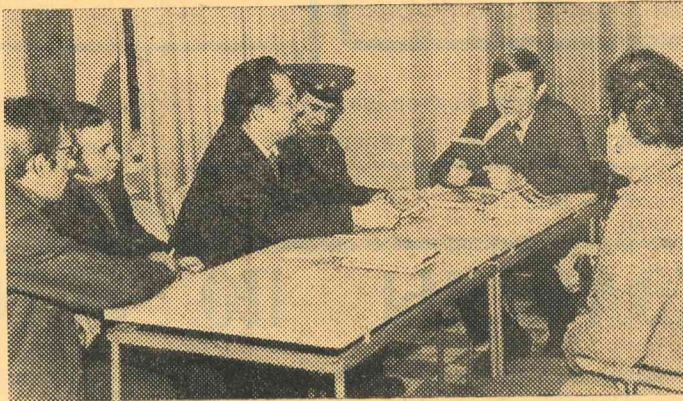
Занятие литературного объединения