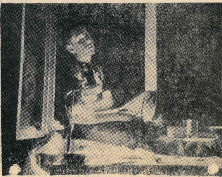
Из работ, представленных на конкурсе «Мы — физтехи».