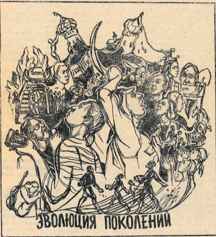
Рисунок «Эволюция поколений» худ. Л. УВАРОВОЙ.