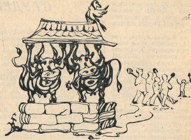
«И, наконец, построили!» Рис. Л. УВАРОВОЙ

Рог-группа. За время игры удушено 3 порка. Товароед. Благоустройство города. Избавительный участок. Дом бардачного типа. Начальник самкционировал. Крашенная капуста. Великопянная картина. Противоедие. Трахфазный ток. Непризванные гении. Каюк кампания. Ваше преподубие. Внедряние. Воблачный покров. Подстолненное масло. Фотоуволочитель. Хорошо оборудованный. Шугающий экскаватор.