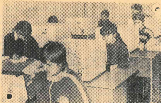
ФАЛТЯНЕ ЗА КОМПЬЮТЕРАМИ