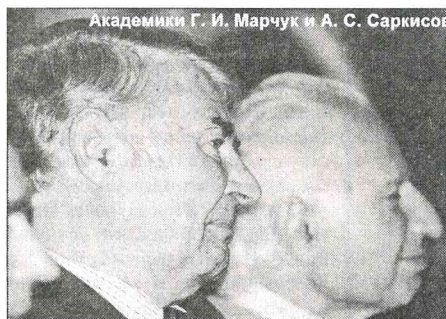
Академики Г. И. Марчук и А. С. Саркисов