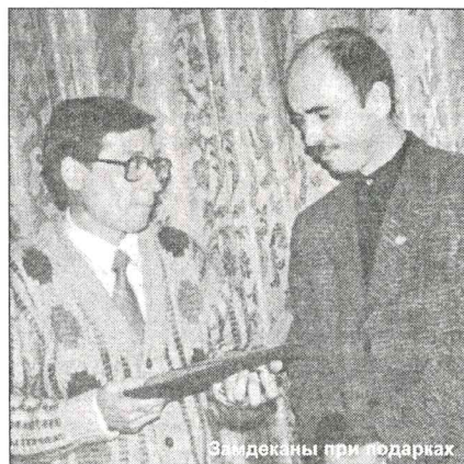
Замдеканы при подарках