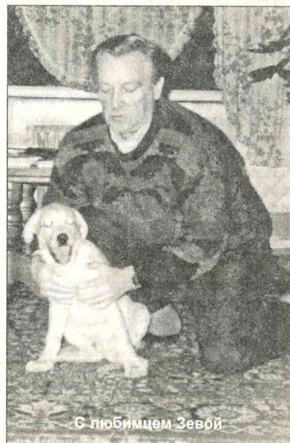
С любимцем Зевой

Читатели физтеховской газеты «За науку» — а это студенты и выпускники, преподаватели и сотрудники, те, кто сегодня рядом, и те, кто уехал за рубеж, те, кто ее получают по почте, по Интернету, на базе или в самом институте, — поздравляют Вас с юбилеем. Желаем Вам, Вашей семье счастья, здоровья, благополучия, удачи, успехов... — всего самого, самого доброго!