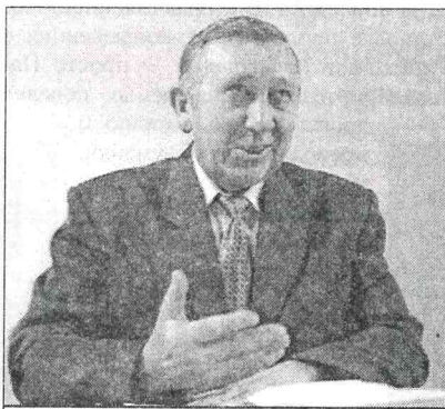
Директора студгородка каждый студент должен знать в лицо!

до, сам приеду, приму участие, и песни даже будем петь. Но все должно в результате заканчиваться хорошим настроением, а не так: в понедельник выхожу на работу и начинаю разбираться, кто кого бил.