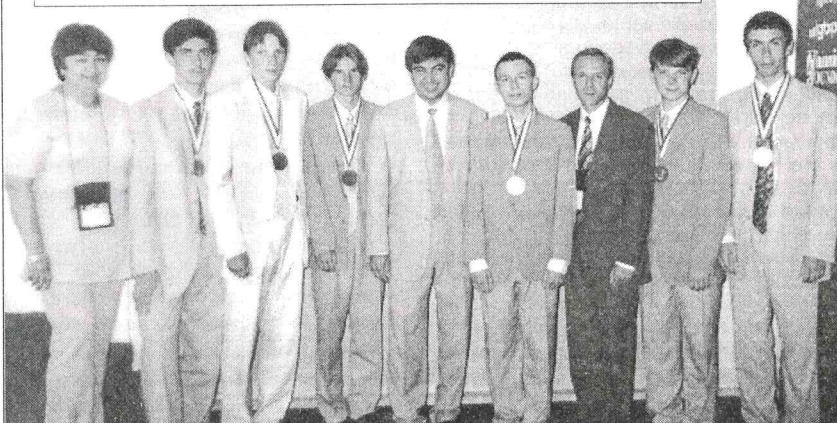
Члены и руководители сборной России — все счастливы!