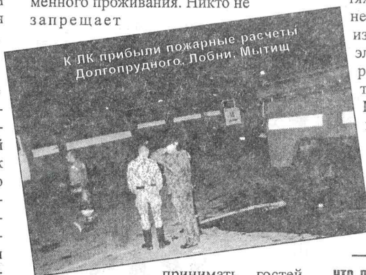
К ЛК прибыли пожарные расчеты Долгопрудного. Лобни. Мытищи

Хотелось бы вот еще о чем поговорить. Начался учебный год, студенты заехали в общежитие. И начались активные, грубо говоря, пьянки, нарушения порядка. Хотелось бы напомнить студентам, что общежитие — это не личная квартира, это общественное место, это институтская собственность, предоставленная студентам для временного проживания. Никто не запрещает