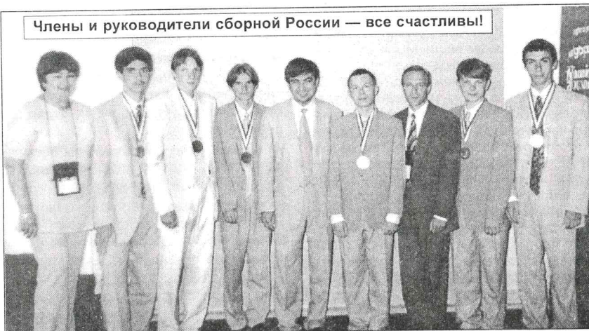
Члены и руководители сборной России — все счастливы!