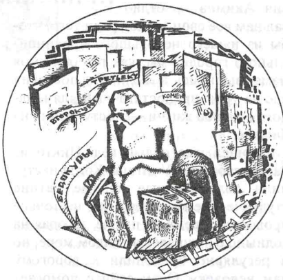
«Бедокуры». Рис. О. Извекова