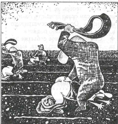
«Воспитание». Рис. С. ОРЛОВА