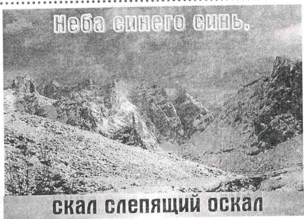
Неба синего синь.