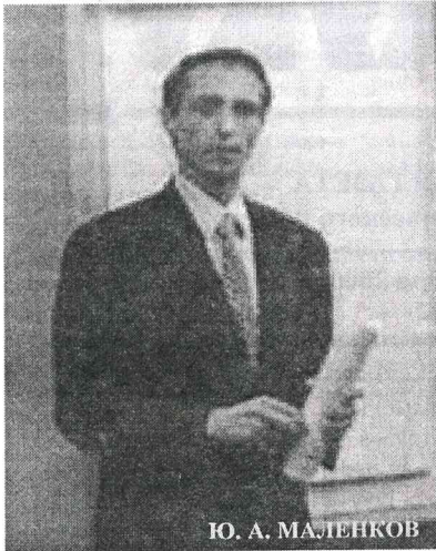
Ю. А. МАЛЕНКОВ