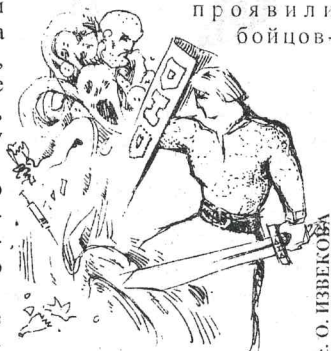
Рис. О. ИЗВЕКОВА

ДНД представляют настоящие гладиаторы, и им не даром доверено право следить за порядком на территории студгородка. К сожалению, из четырех кандидатов ни один не прошел в спецсостав, но все они проявили бойцов-