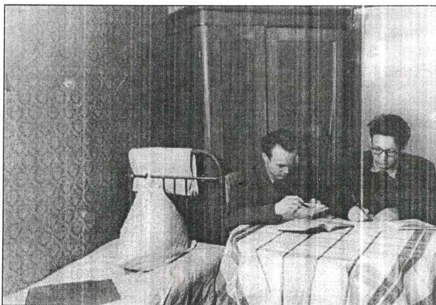
Чего-то здесь не хватает... А, точно, бардака и компьютера! Общага, сессия, 50-е...