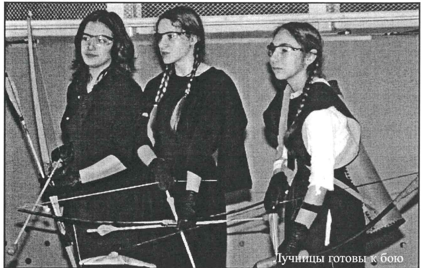
Лучницы готовы к бою