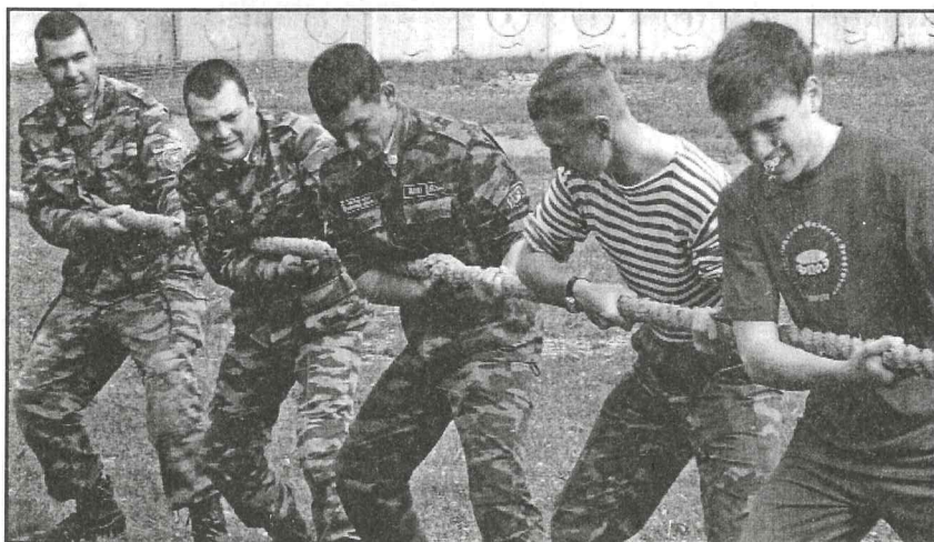
Первый взвод хорошо тянул канат и играл в баскетбол. Второй взвод оказался лучшим в волейболе и поднимании гирь.