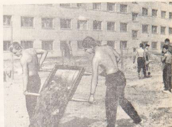
Первокурсники держат трудовой экзамен