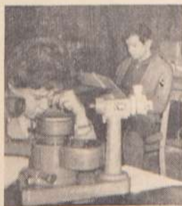
На занятиях по геометрической оптике