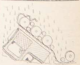
75 капель никотина выводит из строя ДТ-75.

Это был уже пятый перекур за первый час работы. Над стройкой поднимался столб табачного дыма. К концу рабочего дня он превратился в огромную грозовую тучу, залившую полнеба. Помел дождь. Неожиданно стоявшая брком дождя повалилась на бок, расклевала два раза носами в дыму. В каплях дождя содержался никотин.