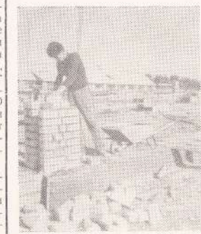
И под нашими руками стены вырастают.

Раньше я думал, что Казахстан — это огромное плоское пространство, по которому гуляют верблюды, жующие верблюжью колбаску, и суслики.