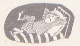
... а следовательно существу.