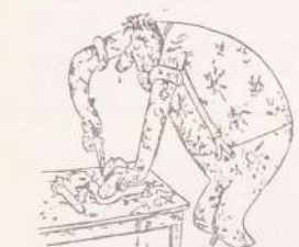
— Кричат: «Исследования, исследования», а порядочного консервного ножа изобрести не могут.