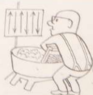
Руководство к действию.