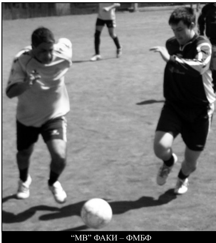
«МВ» ФАКИ – ФМБФ

Очередная победа с разрывом больше пятнадцати очков и сладостное ощущение, что твоя заслуга в этом.