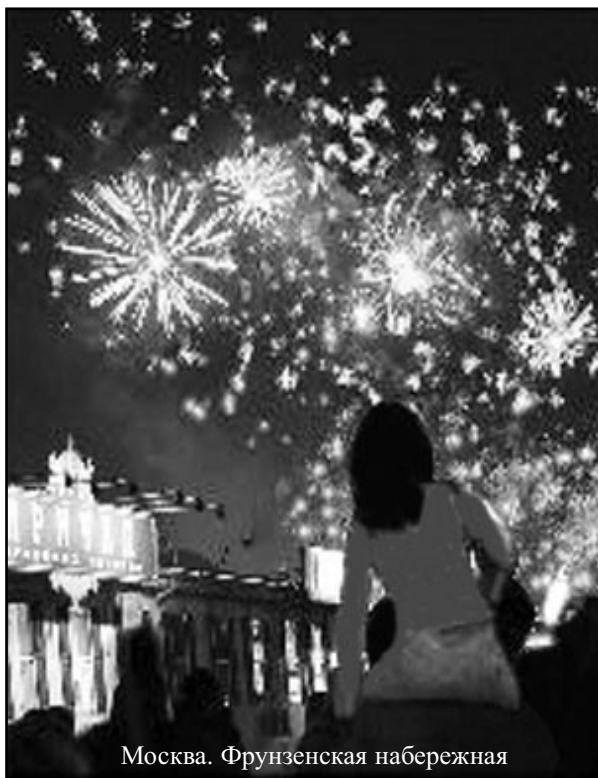
Москва. Фрунзенская набережная

Смотрю на часы 19-48. Старт толпы на колесах намечен на 20-10. Запасаюсь фантой, что бы, если