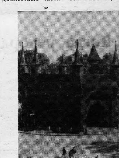
Барбакан (сторожевая башня) в Кракове.

мии, развивая решительное наступление, вышли к Кракову с северо-запада. Фашистские войска, оказавшись под угрозой окружения, вынуждены были поспешно отступить, неся большие потери в живой силе и технике.