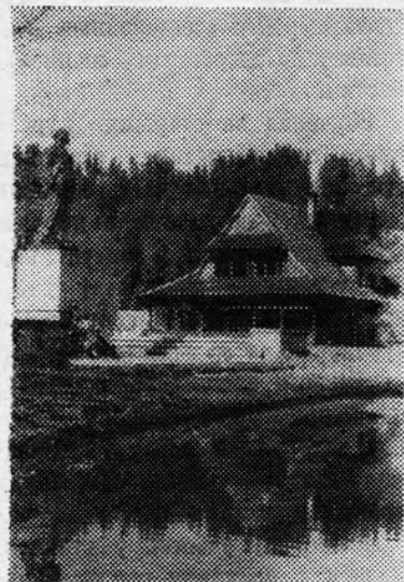
Дом-музей В. И. Ленина в Поронинно.