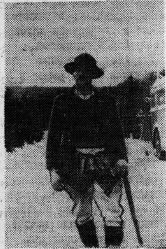
Житель гор—гураль (горец).